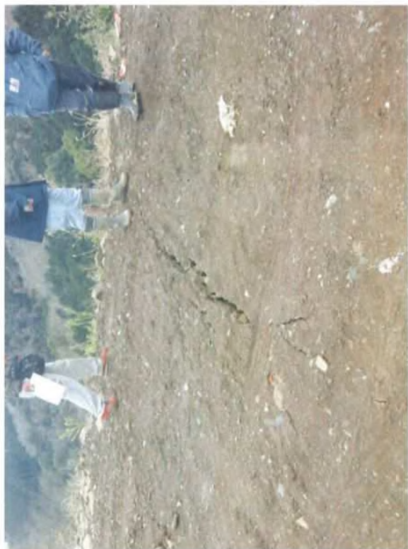
斜面上部クラック