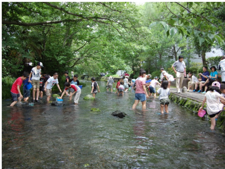
市民の憩いの場所である源兵衛川

■1960年代以降は都市化や流域開発により水質や環境が悪化した時期があったが、1990年代以降、市民、NPO、企業、行政などの多様な主体による、環境保全への取組により、清流が復元し、「水の都・三島」の象徴的施設として市民の憩いの場所となっている。