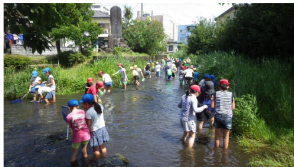
環境教育の拠点にもなっています。