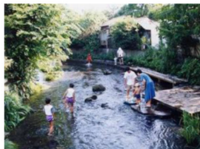
湧水が豊富な源兵衛川(昭和30年代) 汚れた源兵衛川(昭和35年～平成元年)