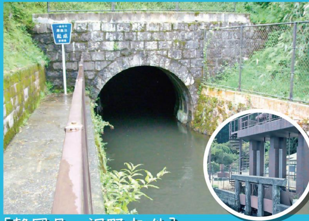
[静岡県・裾野市 他]