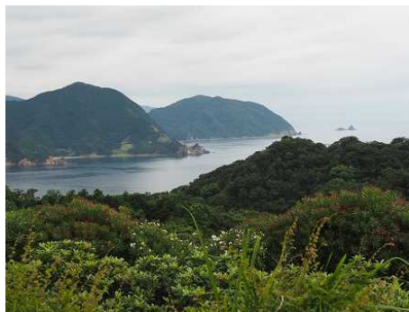
恋人岬 今回の旅のゴール