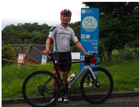
恋人岬の太平洋岸自転車道の看板前で