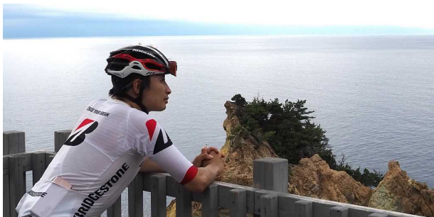
黄金崎 夕暮れも近づいてきた

最後の恋人岬までは黄金崎から5kmちょっと。国道136号をただ走るのみ。恋人岬には、素敵なベンチや太平洋岸自転車道の大きな看板もある。