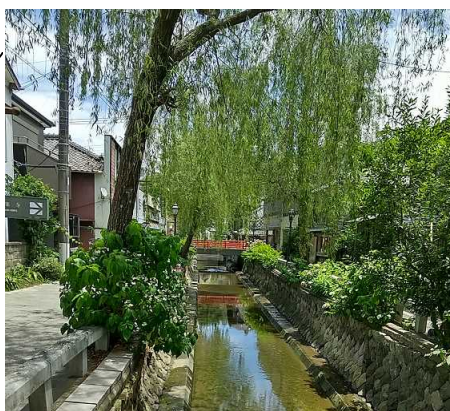
ペリーロードと、ペリー艦隊来艦記念碑