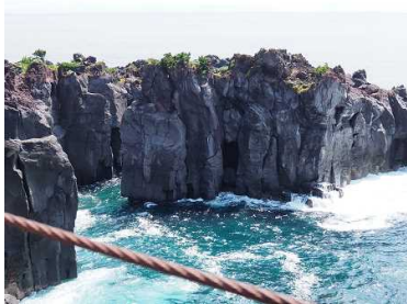
城ヶ崎海岸 美しい海の色