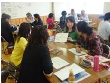
環境教育ネットワーク推進会議の様子