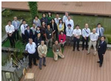
ネットワーク参加団体で記念撮影