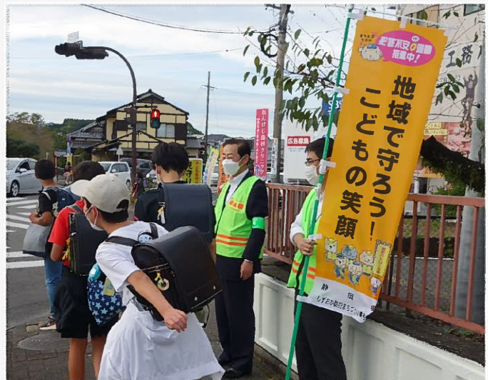
藤枝市、藤枝警察署、防犯ボランティアと連携 して下校する児童の見守り活動と、蓮華寺池 公園において啓発活動を実施しました。

「子ども見守り強化の日」を きっかけにして、子どもを見 守る「目」を増やし、みんなで 子どもの安全を確保しましょ うにゃん!