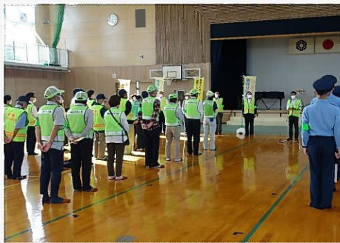
子ども見守り活動に先立ち、 出発式を実施しました。