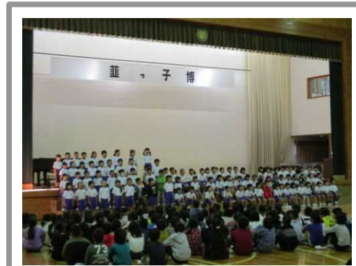
<韮っ子博2019 ステージ発表>

伊豆の国市立韮山小学校では、「韮っ子博2019 開幕セレモニー」のステージ発表において、1年生の各学級が、国語の授業で学習した詩の中からお気に入りの詩を選び、全校児童及び保護者の前で暗唱(群読)した。読む速さや声の大きさを工夫しながら、広い体育館いっばいに響く声で詩を読み上げて、これまでの学びの成果を存分に発揮した。こうした音読・朗読や読書活動を更に広げていくことが必要であるが、この取組に限らず、限られた授業時間の中で活動の時間を確保することが課題となっている。