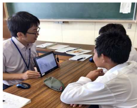
<個別の取り出し指導>

外国人児童生徒一人一人の状況に応じたきめ細かな指導を行うため、相談員や日本語指導コーディネーターの派遣、また、加配教員による個別の取り出し授業を進めている。その結果、一人一人に合った特別の教育課程が編成され、適切な支援を受ける外国人児童生徒の数が年々増加している。しかし、対象児童生徒の増加に伴い、十分な指導ができない市町・学校もあるため、日本語指導を行う教員や支援員等の人員確保、研修等による支援の質的向上を図ることが課題である。