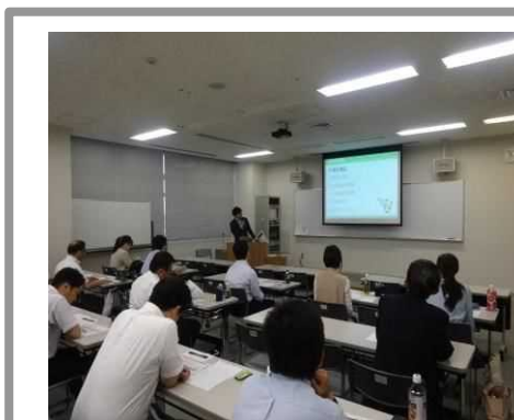
＜公民館等職員研修＞

研修により内容の向上や講座・学級数の増加につながり、学びの場の拡大・充実が図られた。