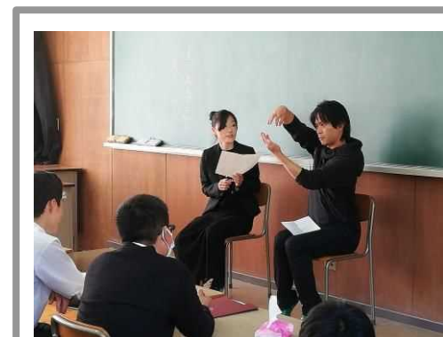
＜SPAC による戯曲化授業＞

生徒及び地域のニーズに応え、子供たちに多様な選択肢を提供できるよう、県立高等学校における特色のある新学科等（「スポーツ」、「演劇」、「観光」、「国際バカロレア」）の創設に向け、調査・研究を進めていく。