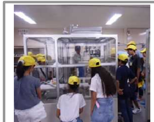
<郷土の産業を学ぶ子どもたち>

子供たちからは「現場での本物の体験に感動した」、教員からは「企業に対する子供の関心が高まり、静岡をより好きになった」といった声が寄せられた。