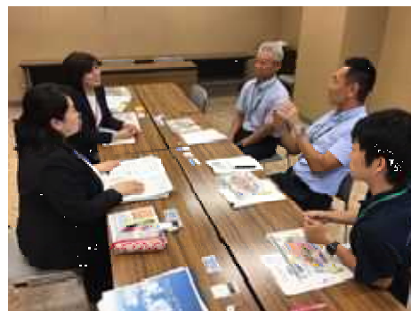
<市町教委でのヒアリング及び支援>

県教委内の各所属が連携し、市町対象の研修会等を企画運営するとともに、コミュニティ・スクール（以下CS）未導入の市町教育委員会を訪問している。訪問では、制度等についての説明の後、各市町の現状をヒアリングし、必要な取組や手順をアドバイスするなど導入に向けた支援を行った。現在、多くの市町が導入に向けて動き始めており、小・中学校のCS導入校数は、今年度が108校、来年度は約180校となる予定である。今後も、CSと、幅広い住民の参画を得て行う地域学校協働活動の双方が一体となって学校運営に関われるよう、研修会等の内容を精選し、支援していく。