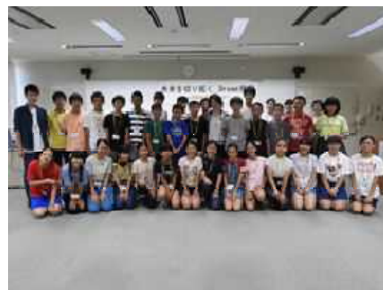
<Dream 授業に参加した中学生> 2019年度：参加者30人（応募件数107人） 3泊4日（8/6～9実施）

将来、日本や世界で活躍したいと考えている子供たちに、世界トップクラスの講師陣の講義を提供し、学校では学ぶことのできない教養を身に付け、お互いに刺激し合える仲間を県内各地につくることで、子供たちが自らの価値を認識し、自らの能力を更に伸ばすきっかけを与える。この目的の下、実施2年目を迎えた2019年度は、川勝知事をはじめ、スポーツ、科学、芸術などの分野で活躍する一流の講師による講義のほか、「みんな知事になって理想のまちをつくらう」をテーマにディスカッションや異文化交流を体験した。