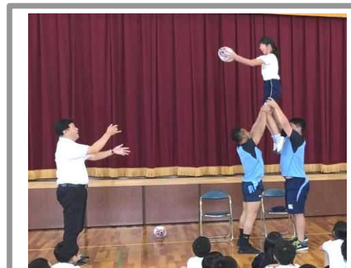
<ヤマハ発動機ジュビロの現役選手による交流型授業>

ラグビーの道徳的・教育的価値を子供たちの人格形成に活用するため、ラグビー教本を制作して、県内の国公立・私立小中学校及び特別支援学校約800校(全校)に配布し、授業等で活用する取組を進めた。また、重点的に授業等を行う学校(72校)には、ヤマハ発動機ジュビロの現役選手等が学校訪問して交流型の授業を行った。その他、エコパ開催3試合に小中高生等約25,000人を無料招待し、“一生に一度”と言われるラグビーワールドカップの熱狂と感動をスタジアムで体感する機会を提供した。