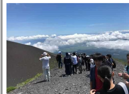
＜富士山でのフィールドワーク＞

地域を理解し、地域に貢献する人材を育成するため、高等学校の生徒と教員を対象に伊豆半島ジオパーク協議会等から講師を招き、富士山や伊豆半島ジオパークのフィールドワークを実施しており、例年 80 人以上が参加している。令和元年度は、富士山の宝永火口や樹林帯を歩きながら、富士山の噴火やその後の生物の進出について説明を受けた。富士山世界遺産センターでは、文化的な視点からの富士山についての講話を受けるとともに、ゼラチンを使った噴火メカニズムの実験を行い、本県のシンボル「富士山」への理解を深めた。