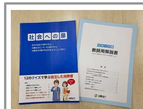
＜消費者教育教材「社会への扉」＞

今後も、成人を含め消費者教育が幅広い年齢層に浸透するよう、県と県教育委員会が連携し取り組んでいく。