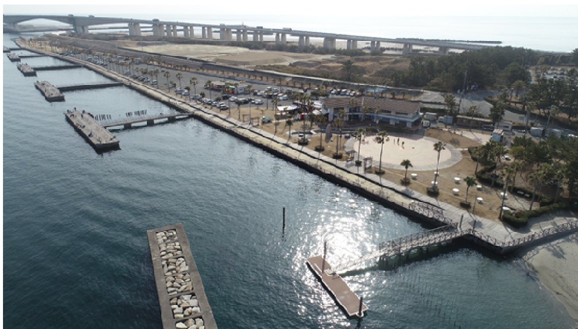
新居弁天海釣公園・海湖館棧橋(空撮)

この花博20周年事業を環浜名湖が一体となって推進し、賑わいを創出するために、湖西市においても静岡県・浜松市と連携し、湖西市の地域資源を活かした『花の都づくり』に繋がるイベントやツアー等を実施する。