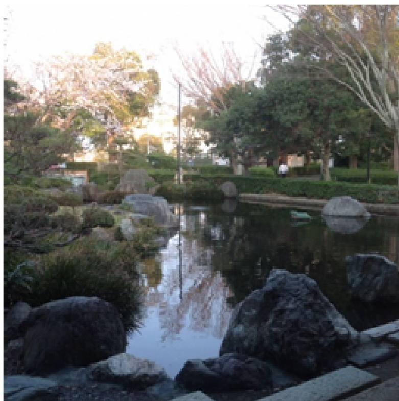
中根庭園（新居図書館）

湖西市新居町内に所在する故 中根金作 氏（昭和の小堀遠州と称えられた世界的造園家）及び中根庭園研究所が手掛けた日本庭園、緑道、花壇などの再整備と、観光案内看板の設置を実施する。また、新居関所から中根庭園、市内浜名川沿いの緑道などを巡る“まちあるき”を計画するとともに、湖西市内の花・緑を紹介するパンフレットを造成、花博会場とともに一体的な活性化を目指す。