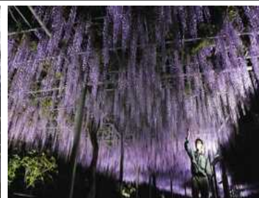
長藤の夜間ライトアップ

●藤棚 長藤、白藤など時期をずらしながら、様々な藤が楽しめる。夜間ライトアップで幻想的な世界を演出します。 実施期間 4月下旬から5月上旬まで 時間 18:30~20:30