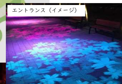
エントランス (イメージ)

●噴水池 「大噴水ショー」では水と音と光のコラボレーション、ウォータースクリーンによるプロジェクションマッピングが楽しめます。