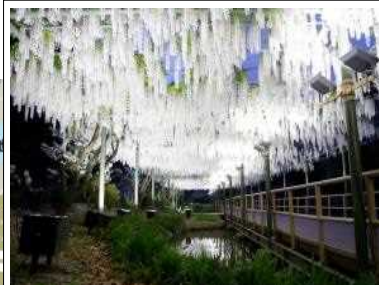
白藤の夜間ライトアップ