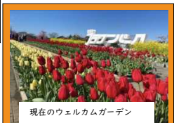
現在のウェルカムガーデン