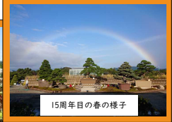
15周年目の春の様子