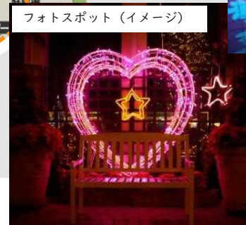
フォトスポット (イメージ)