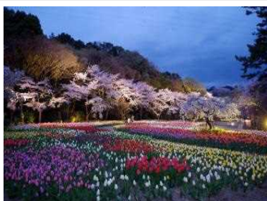
桜とチューリップの夜間ライトアップ