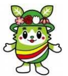
マスコットキャラクター 「ふらまる」