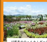
10周年のウェルカムガーデン