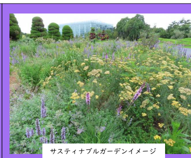
サスティナブルガーデンイメージ

野原のようなナチュラルな風情があり、やさしく咲く花々にそよぐ風やきらめく光を感じる、グラスと宿根草、球根がメインのサスティナブルガーデン。花期や見頃の異なるグラスや宿根草、球根を最初から多種組合せます。また、日本原種の野草や改良種、蝶や蜜蜂などの生き物が好む草花も多く入れ、植物豊富な生物多様性ガーデンとして構成します。