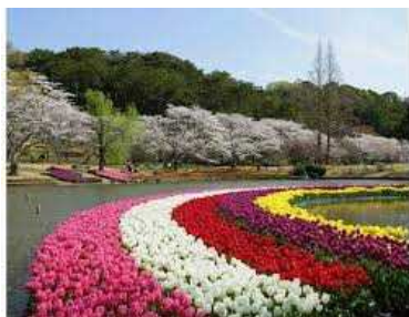
【世界一美しい『桜とチューリップの庭園』】 桜1300本とチューリップ50万球の競演。

これまで整備してきた各エリアの充実を図るとともに、外周エリア西側・高台エリア・エントランスエリアを整備することで、新たな花みどりの魅力の創出を図っていきます。