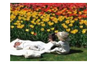
フォトコンテスト