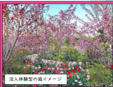
没入体験型の庭イメージ