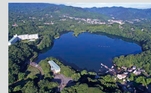
一碧湖 [単成火山:火口に水が溜まったもの]