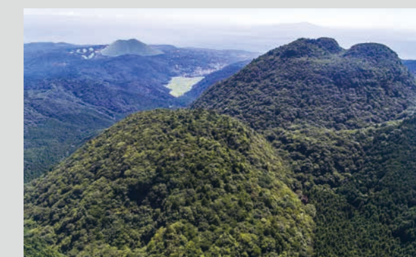
矢筈山(右奥)と孔ノ山(左手前) [単成火山:粘性の大きな溶岩の高まり]