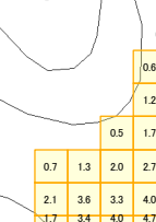
様式-2 津波災害警戒区域 区域図

【背景地図】 ○「背景地図」は平成25年に刊行された数値地図（国土基本情報）電子国土基本図（地図情報）をもとに作成しているため、道路や建物などが現況と異なっている場合があります。