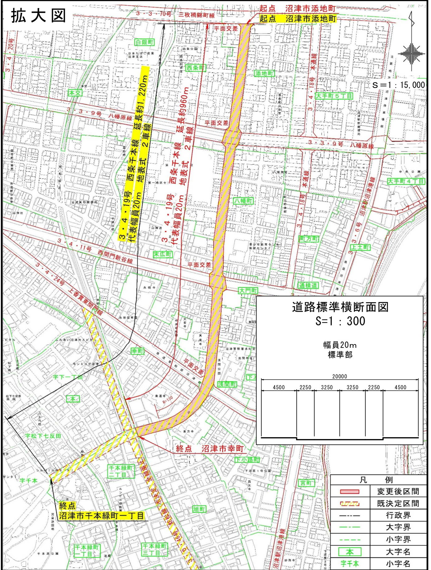
道路標準横断面図 S=1 : 300