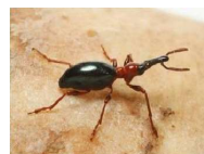
アリモドキゾウムシ