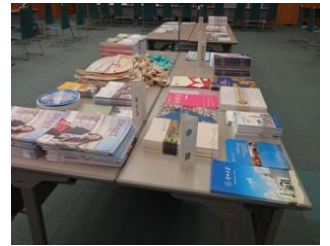
■ 資料配布コーナー