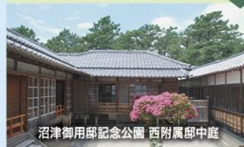
沼津御用邸記念公園 西附属邸中庭

明治26年に造営され、明治・大正・昭和の三代に渡り使用されました。昭和44年廃止の翌年には記念公園となり、美しい庭園や邸が公開され、当時の皇族の暮らしにふれることができます。当日は、春の訪れを感じるイベントが開催予定です。