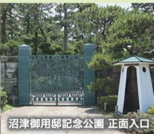
沼津御用邸記念公園 正面入口