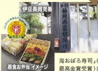
伊豆長岡見番 昼食お弁当 イメージ

最盛期の芸妓衆は400人を超え、京都と伊豆長岡にしかない希少な「公認伊豆長岡芸妓学校」を設立した歴史を持ち、現在も稽古場として使われております。当日は、伝統文化でもある「お座敷遊び」を体験。昼食は、名店「だるま」の、「伊豆山海おぼる寿司」(ふじのくに新商品セレクション2017最高金賞受賞)弁当をご用意します。