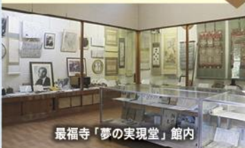
最福寺「夢の実現堂」館内

境内に芹沢光治良の文学碑がある他、町内遺跡発掘品や土肥城主富永山城守に係る伊豆水軍系図等郷土資料や、明治時代の三舟(海舟・泥舟・鉄舟)の書等を展示する資料館「夢の実現堂」があります。ツアー当日は特別に職蔵がご案内します。