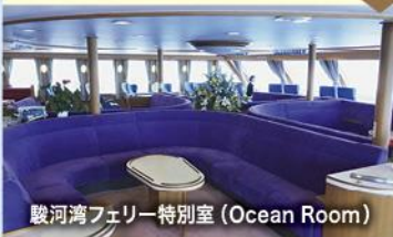
駿河湾フェリー特別室 (Ocean Room)

清水港と土肥港を70分間で結ぶ大型観光フェリー。海上から眺める雄大な富士山は絶景。航路は、県道223(ふじさん)号に認定されています。当日は、特別室(Ocean Room)をご用意。特別室からの雄大な眺めと、案内人の軽快なトークをお楽しみください。