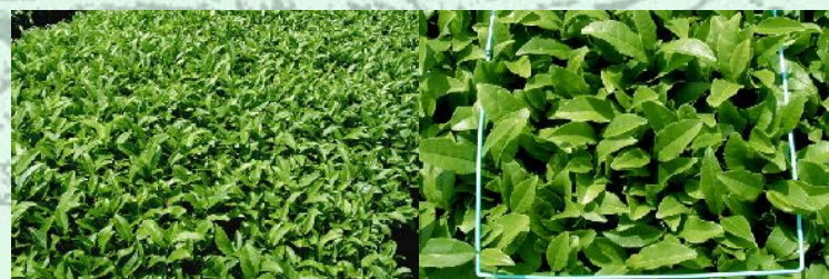
防除適期頃の新芽の状態

問い合わせ先 生産環境(病害虫) 0548-27-2885 代表 0548-27-2880 E-mail: ES-kenkyu@pref.shizuoka.lg.jp