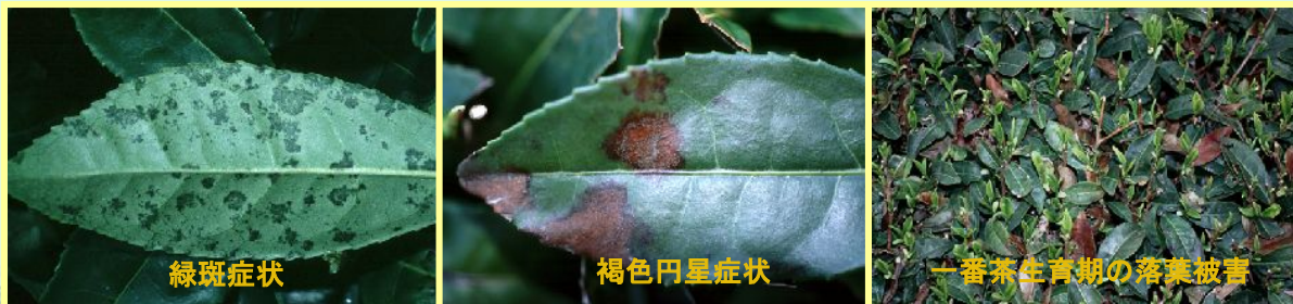
褐色円星病の病徴と被害