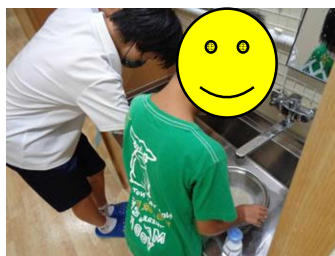
ごはんを炊いてみよう〔星寮・虹寮〕