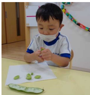
そら豆のさやむき〔幼児班〕

夏休みには、2階のほし、にじユニットの子どもたちは、お米をといで炊飯器で炊く体験をしました。初めての体験でボウルからお米を少しこぼしてしまう子、いつ炊ける？と楽しみにする子、慣れた様子で行う子などがいました。炊きたてのご飯を食べ、子ども達からは「おいしい！」との声が聞かれ、あっという間に食べ終わりました。「またやりたい！」との声に答えていきたいと考えています。学園では、子どもたちに食に関する楽しい体験の機会を提供していきます。