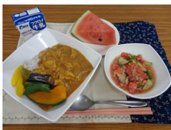
地産地消の日メニュー（7月）