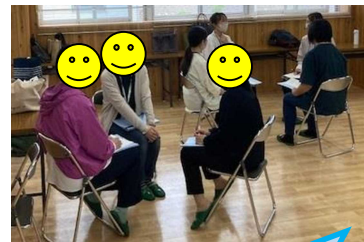
『対人援助スキル研修会』の様子です

学園の子どもへの支援はもちろん、県内の障害児支援機関にも貢献できるように、スタッフ一同、がんばっています！