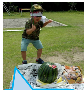
すいかはどこだー！！

今月号では空寮を紹介します。空寮は幼児ユニット「そら1」、中重度女子ユニット「そら2」の2つのユニットがあります。そら1の幼児さん達は工作やお絵かきが大好きで、作った作品でルパンごっこやお茶会ごっこで盛り上がっています。外遊びでは砂場でダムを作ったり、虫を捕まえて見せ合いっこをしています。最近鉛筆練習も始めて楽しく力をつけています。そら2の女子達はみんな活動的で、歌とダンスが好きな子、絵を描くのが得意な子、お手伝いをよくしてくれる子などいます。空寮一同、自分の身の回りのことができるように元気にがんばっています。この夏もいい汗かきます！