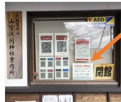
災害時の避難所で↑

はい 入ることは できません ころなういるす コロナウイルス (COVID-19) で びょうき ひと 病気の 人が 増えて います。 あいだ たてもの しばらくの間 この建物に はい 入ることは できません。