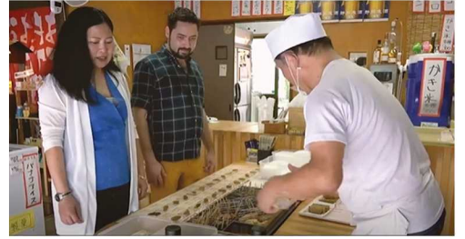
おもてなしの場面で↑