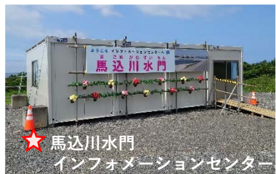
★ 馬込川水門 インフォメーションセンター