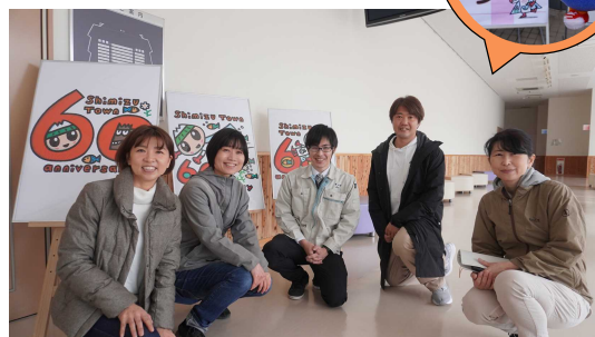
写真↑：サロン運営に関わった方々 (清水町産業観光課、清水町商工会、(一社)いちご)