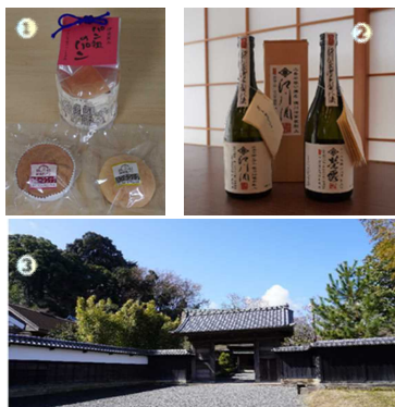
写真：①パン祖のパン ②江川酒 ③江川邸外観

NPO法人伊豆学研究会は、伊豆地域の文化財の保護・利活用や自然環境の保全・利活用、まちづくり活動を行い、地域の活性化に資する活動を行っています。