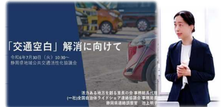
▲7/30説明会 (講師:(一社)全国自治体ライドシェア連絡協議会事務局長)