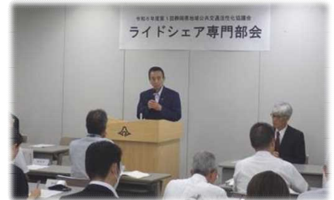
▲9/11 第1回ライドシェア専門部会(知事挨拶)