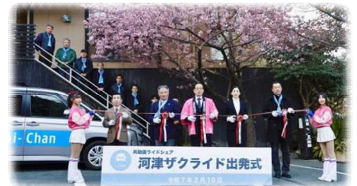
▲新たな実証運行の動き R7. 2 河津ザクラライドの出発式

公共ライドシェア等を県内全域に展開することにより、 地域交通の最適化を図り、交通空白の解消を目指す。