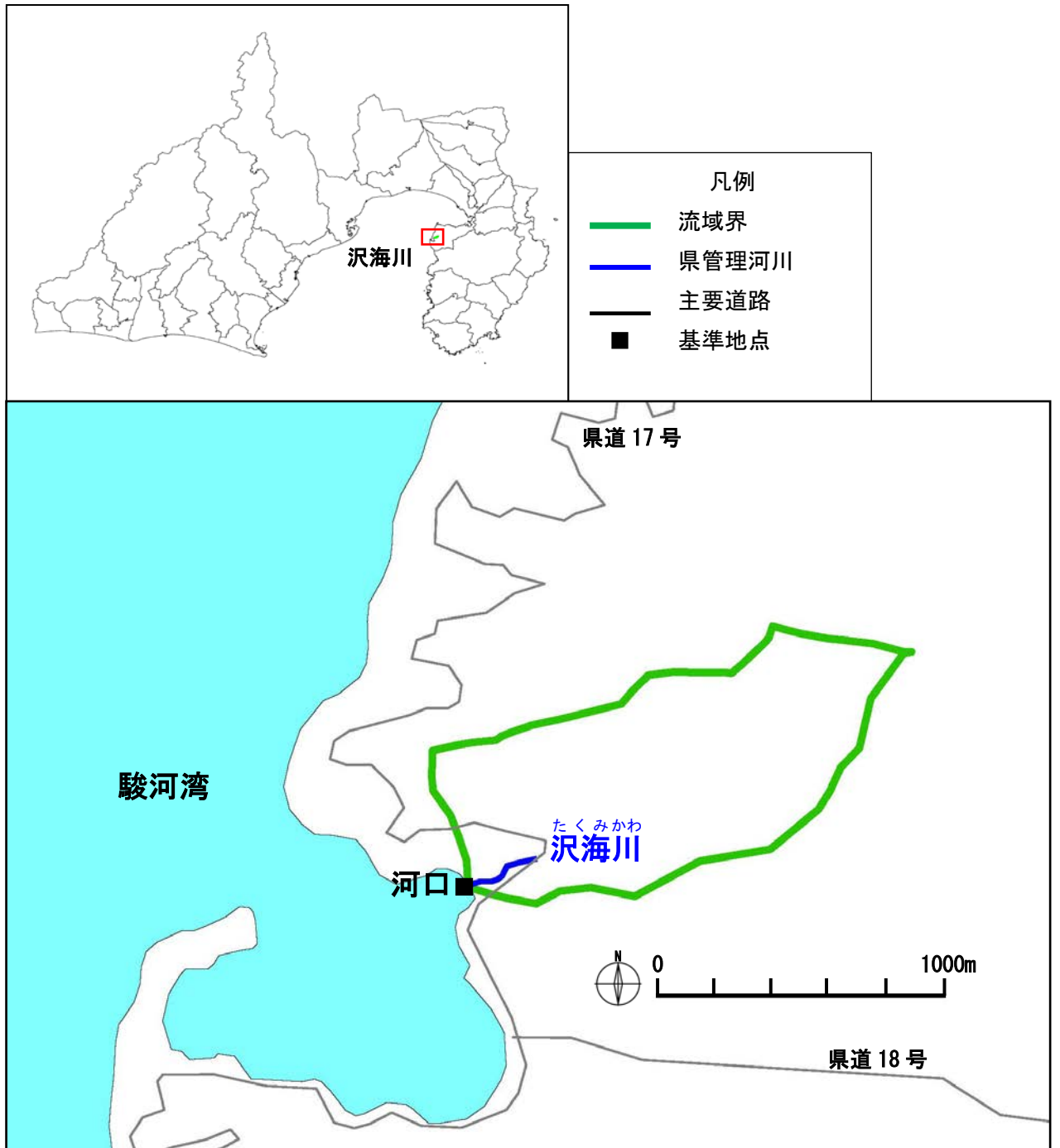
(参考図) 沢海川水系図