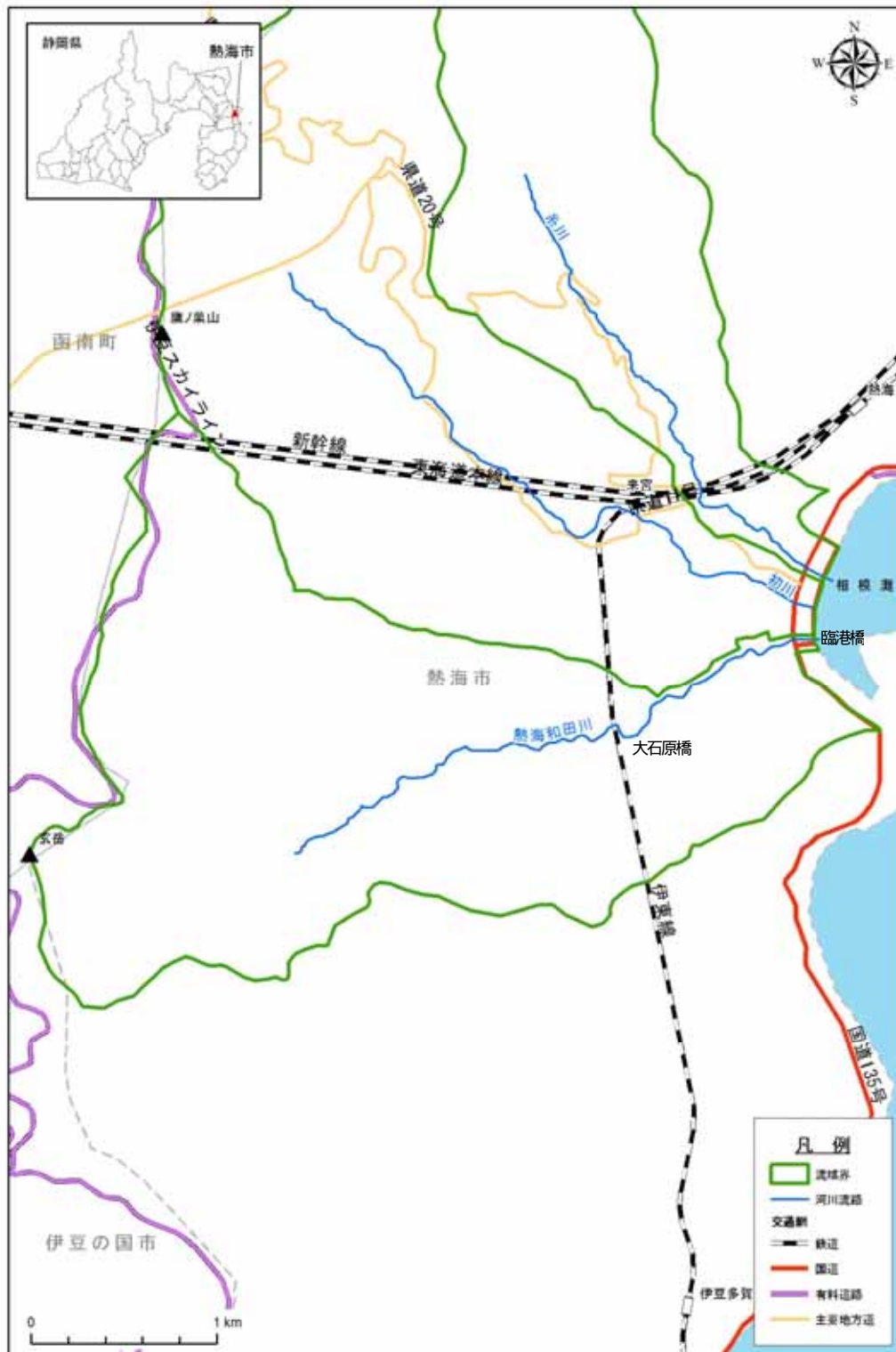
(参考図) 熱海和田川水系図