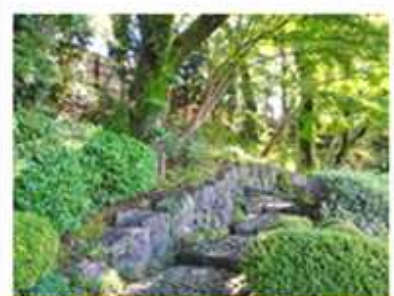
高低差を利用した和風庭園