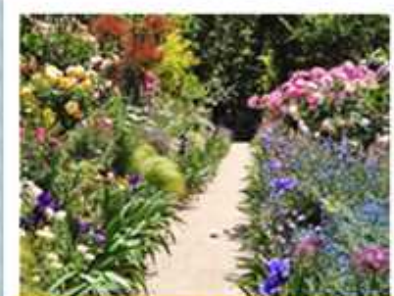
色とりどりの西洋式の庭園