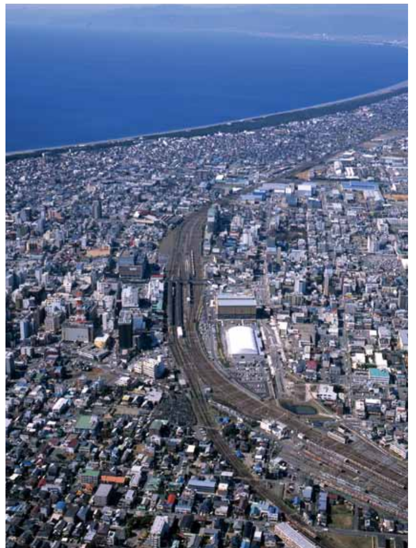
沼津駅周辺の様子