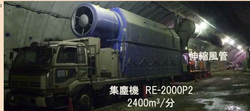
集塵機 RE-2000P2 2400m 3 /分

トンネル坑内の作業場所は、重機の排気ガスや吹付コンクリートの粉じんが充満しやすい環境です。そこで、これらの粉じんを、【 集塵機 】とよばれる大型の空気清浄器のようなものを用いて、きれいにします。また、静浦トンネルでは、【 伸縮風管 】と呼ばれる掃除機のノズルのような伸び縮みするダクトを 集塵機 に取付け、ホコリを発生源ですばやく吸い取る工夫をしています。