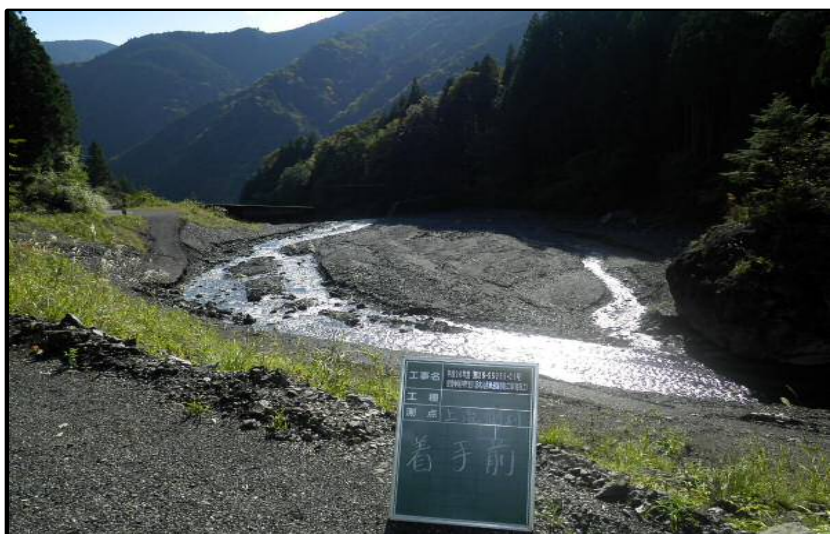
着 手 前