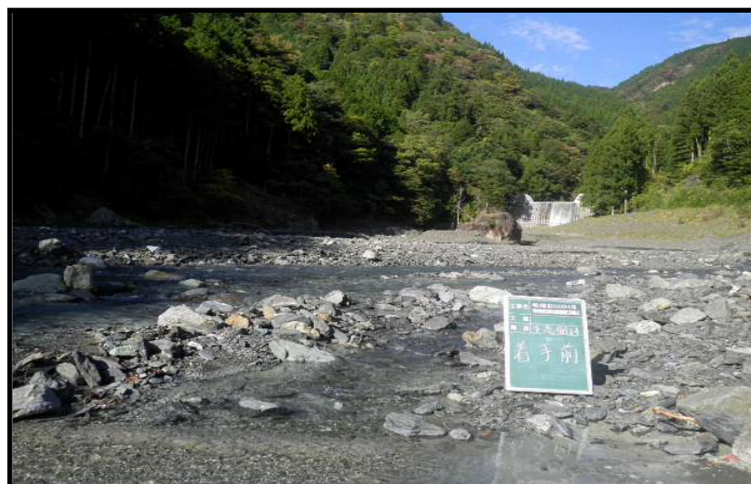
着 手 前