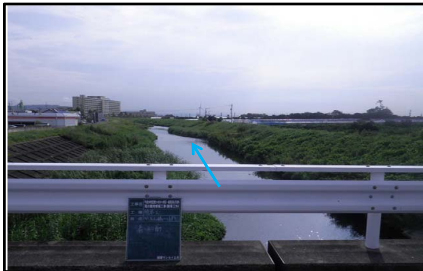
着 手 前