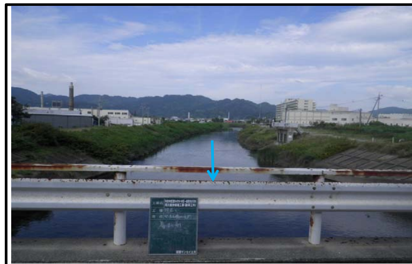
着 手 前