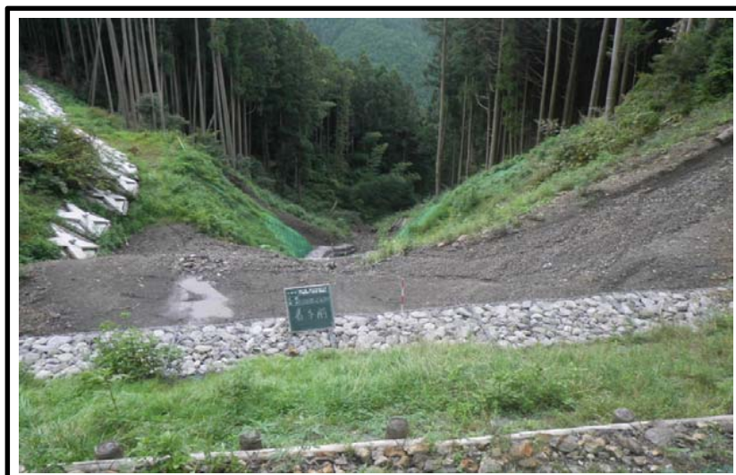
着 手 前