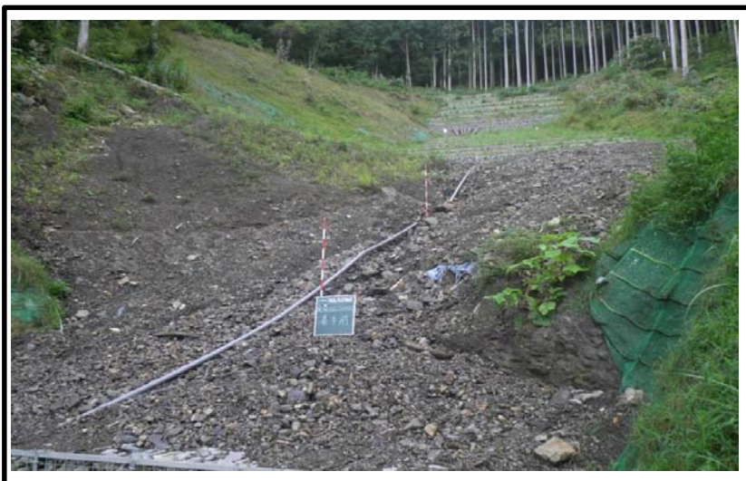
着 手 前