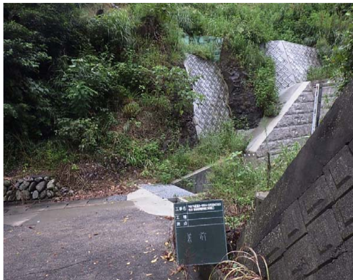
着 手 前