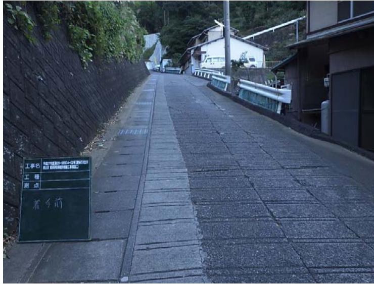
着 手 前