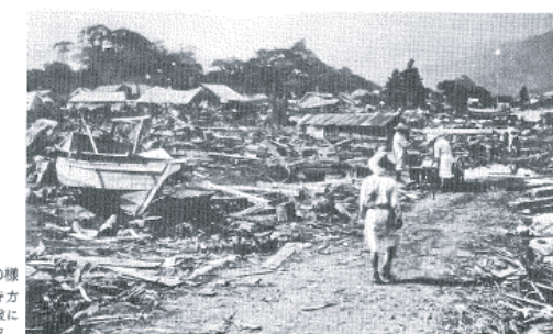
図14-8 現静海町の様子 仏光寺方向を見た津波による被害状況