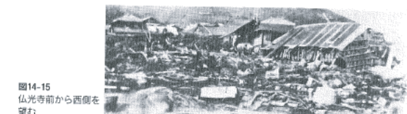
図14-15 仏光寺前から西側を望む