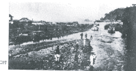
図14-13 伊東大川河口付近の様子