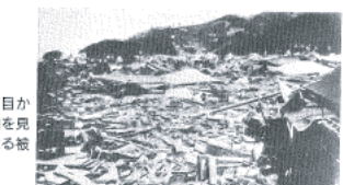
図14-16 現和田1丁目から新井方向を見た津波による被災状況