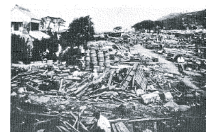
図14-7 玖須美の津波被災状況