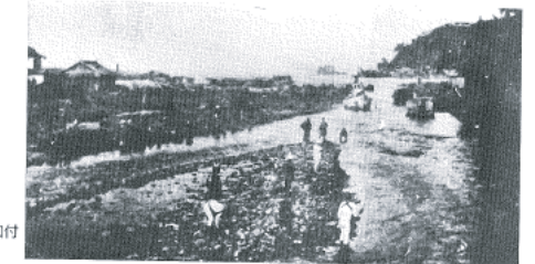
図14-13 伊東大川河口付近の様子