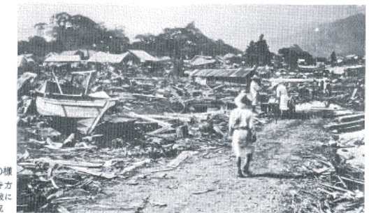
図14-8 現静海町の様子 仏光寺方向を見た津波による被害状況