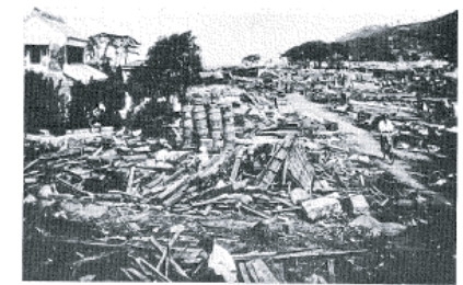
図14-7 玖須美の津波被災状況