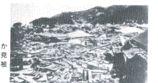
図14-16 現和田1丁目から新井方向を見た津波による被災状況