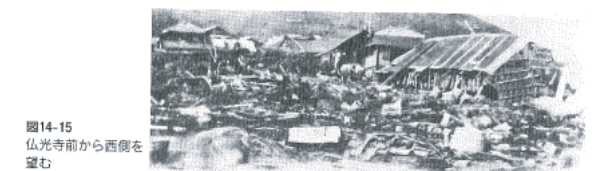
図14-15 仏光寺前から西側を望む