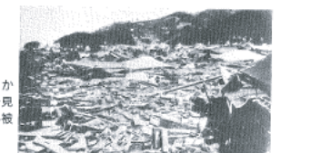
図14-16 現和田1丁目から新井方向を見た津波による被災状況