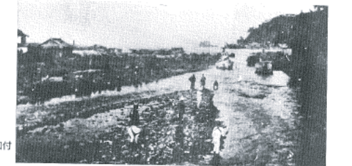
図14-13 伊東大川河口付近の様子