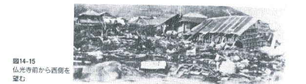
図14-15 仏光寺前から西側を望む