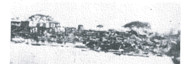
図14-14 仏光寺前から東側を望む