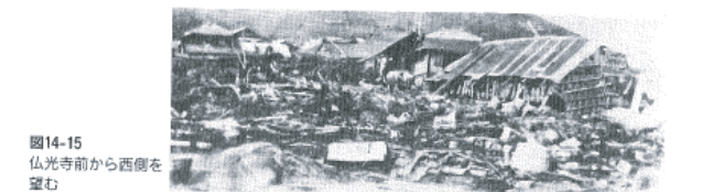
図14-15 仏光寺前から西側を望む