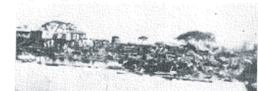
図14-14 仏光寺前から東側を望む