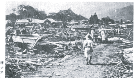
図14-8 瑞穂町の様子 仏光寺方向を見た津波による被害状況