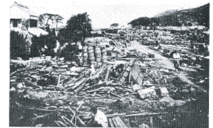
図14-7 玖須美の津波被災状況