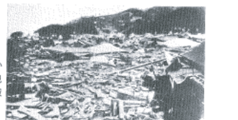
図14-16 環和田1丁目から新井方向を見た津波による被災状況