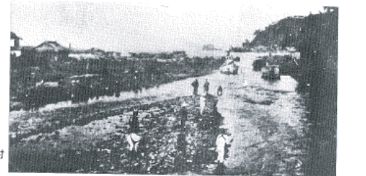
図14-13 伊東大川河口付近の様子