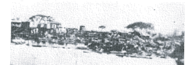
図14-14 仏光寺前から東側を望む