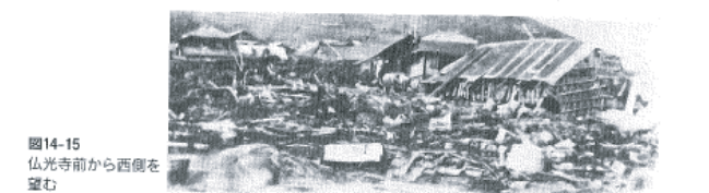
図14-15 仏光寺前から西側を望む