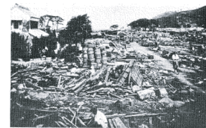
図14-7 秋葉原の津波被災状況