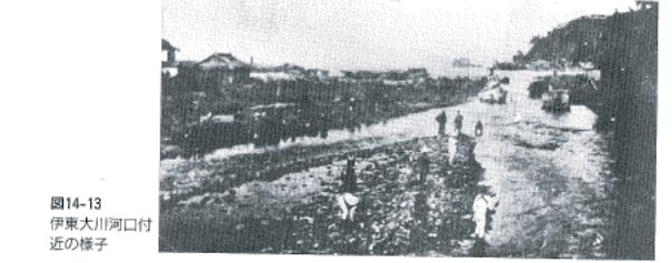
図14-13 伊東大川河口付近の様子