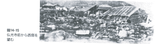
図14-15 仏光寺前から西側を望む