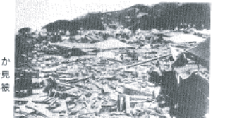
図14-16 現和田1丁目から新井方向を見た津波による被災状況