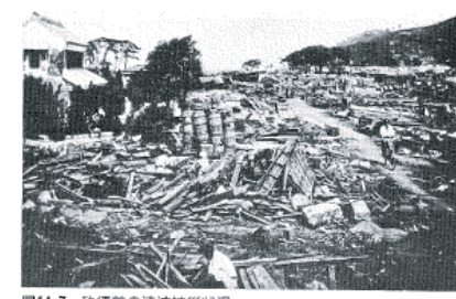
図14-7 茨須美の津波被災状況