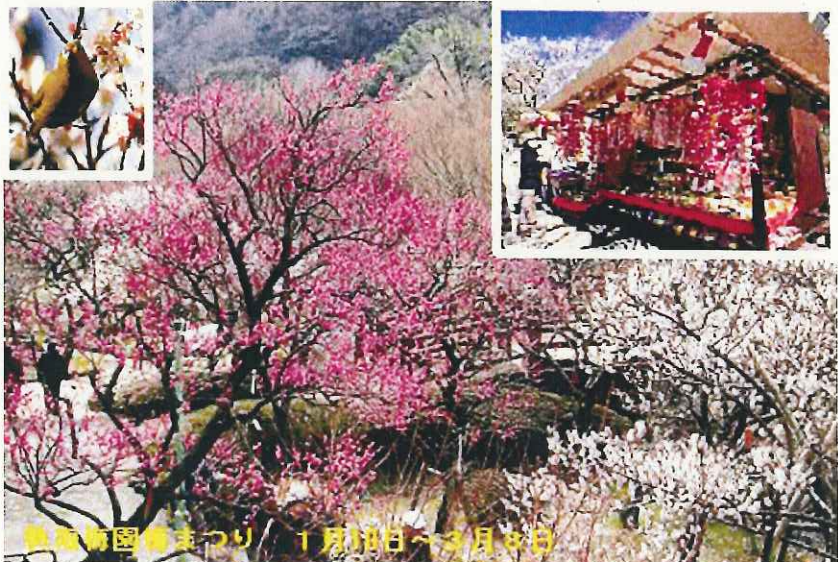
熱海新園地まつり 1月30日～3月30日