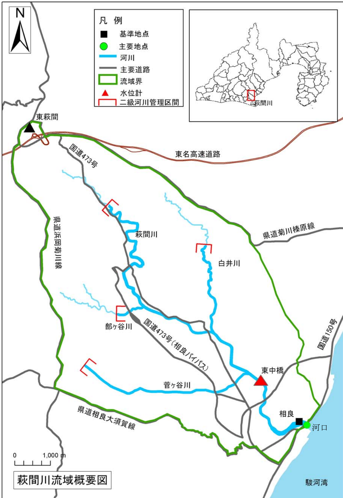
(参考図) 萩間川水系図