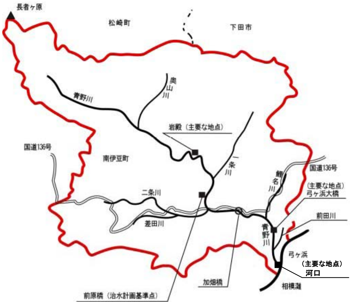
流域図 S = 1/75,000