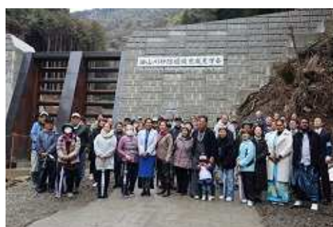
【完成した堰堤の前で集合写真】