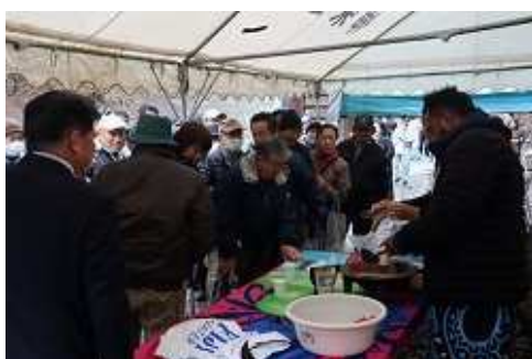
【フィジー共和国大使館による「カバ」の試飲】