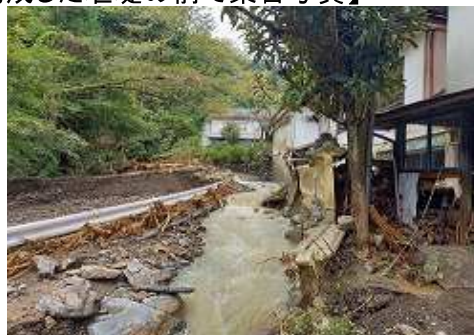
【令和4年台風第15号による被害状況】