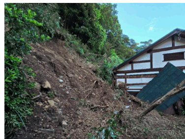
がけ崩れの被害状況（熱海市下多賀）