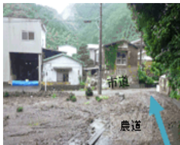
土石流の被害状況（静岡市葵区慈悲尾）