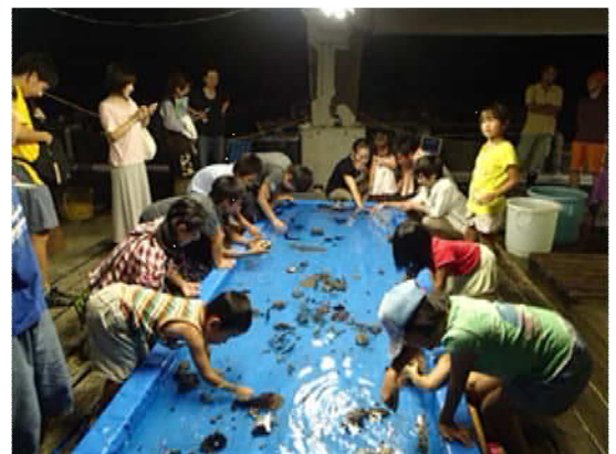
平成25年夜間解放の様子