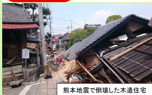
熊本地震で倒壊した木造住宅