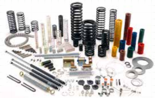
常時5,000種類を揃える

荷と部門別機能で処理をすることにより、部門間で行き来する情報の量が多くなり、小さなミス、行き違い等の問題に繋がることになる。そこで、次の考え方によりこれらのリスクを軽減する取組に挑戦している。