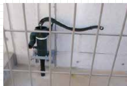
災害時ライフラインとして使用できる工場横の井戸水