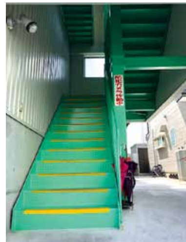
工場屋上への避難階段。 地域住民も避難できるよう外階段となっている