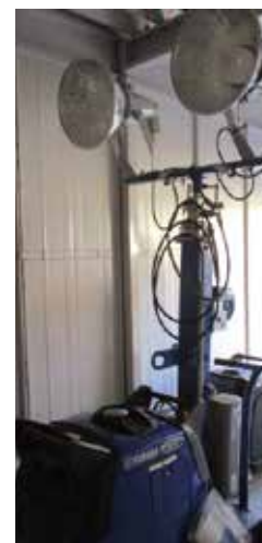
災害時以外でも点検を兼ねて地域の住民が活用できる投光機