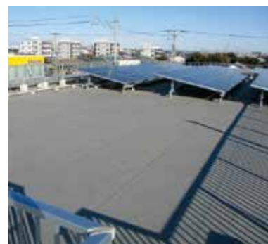
本社屋上の太陽光発電