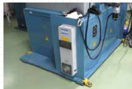
工場内設備を固定し転倒を防止