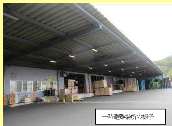
一時避難場所の様子