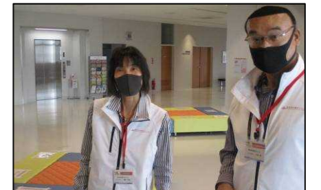
インストラクターさんが丁寧に説明してくださいました。