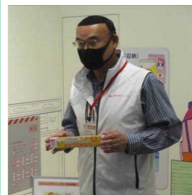
1枚羽織るだけで、とても温かくなりますよ。