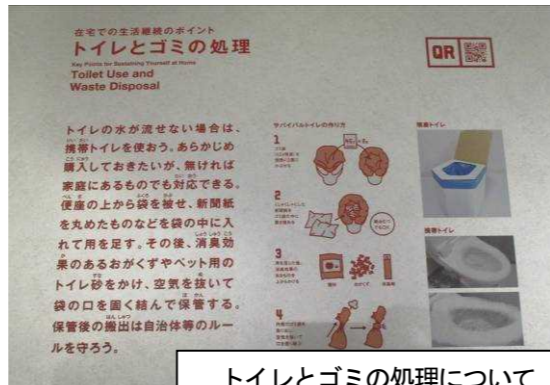
トイレとゴミの処理について

冬は冷えるので、トイレが近くなります。「食べること、飲むこと」と「排泄すること」はセットですので、携帯トイレの備蓄も忘れないようにしてください。トイレを気持ちよく使うことができないと、災害関連死につながる可能性があります。ビニール袋など、家庭にある物でも代用ができます。また、ペットの分と併せて消臭効果のある『猫砂』を備えているという方もいらっしゃいます。