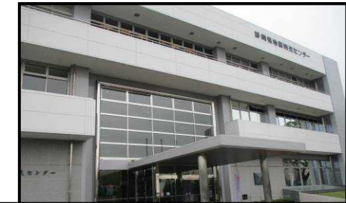
取材：静岡県地震防災センター（静岡市葵区駒形通） 防災力の啓発・創造・発信拠点施設です。

冬に向けて、備えておいた方がよい備蓄品、非常用持ち出し品等の防災グッズにはどのようなものがありますか？