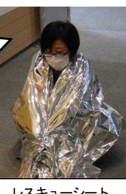
レスキューシート