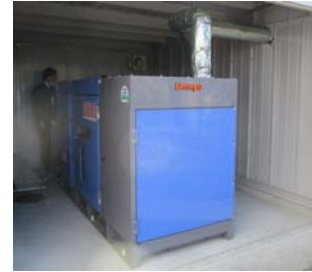
(非常用の発電装置)

中部地域局では、平成30年の台風24号や西日本豪雨等で被災した企業のBCP・災害対応事例を取材し、「災害対応・BCP事例集」を作成しました。