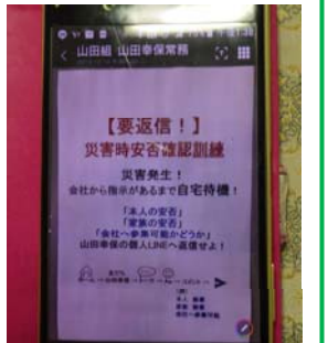
(ラインによる安否確認訓練)