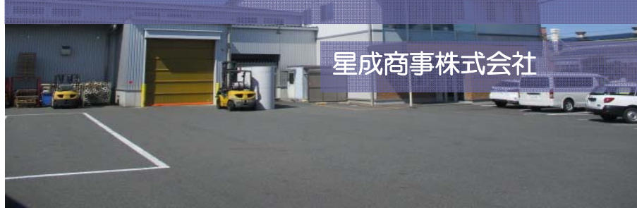
星成商事株式会社