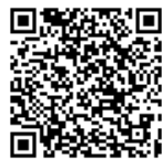
災害対応・BCP事例紹介

http://www.pref.shizuoka.lg.jp/soumu/so-450a/bcp.html